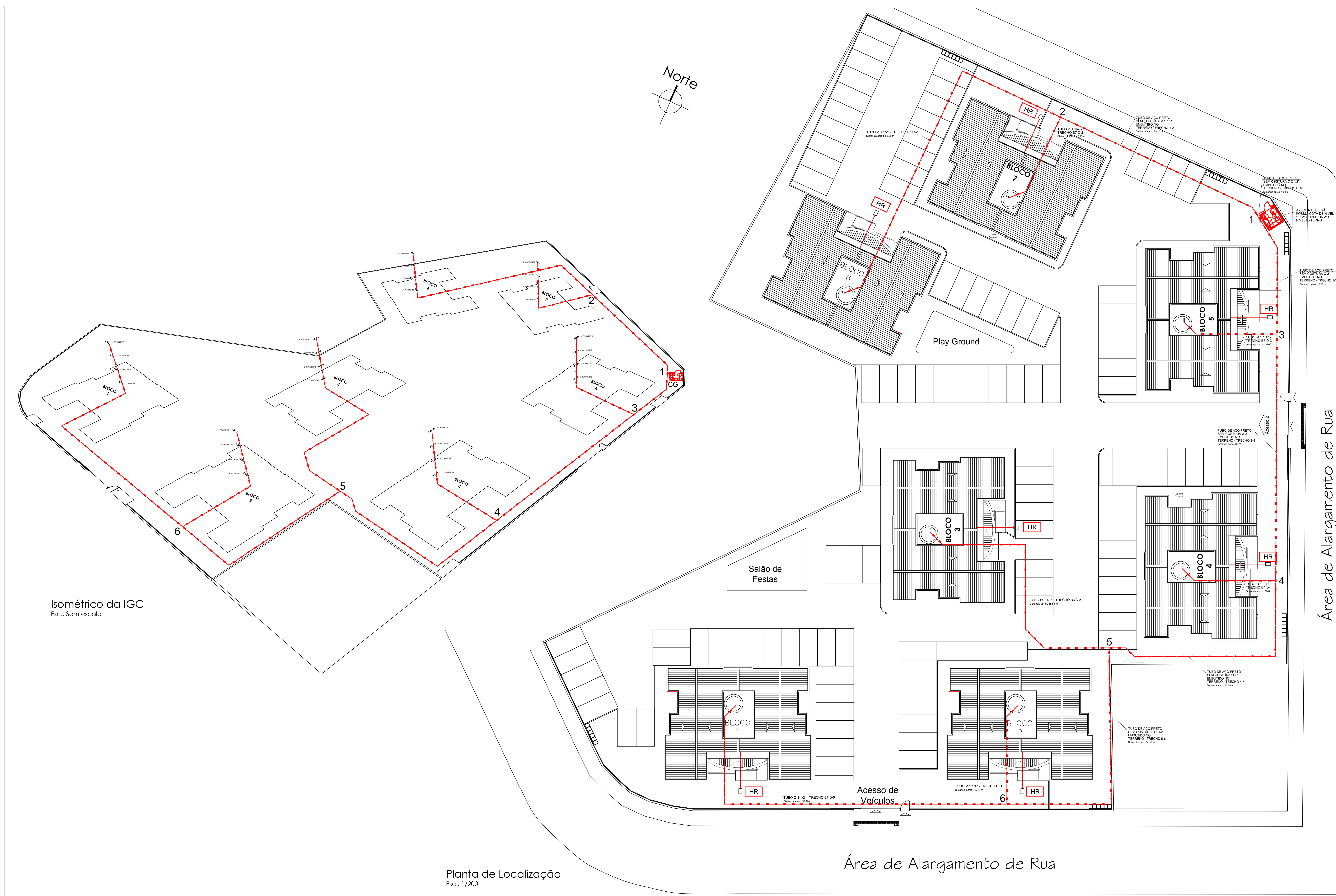
Isométrico da IGC Esc.: Sem escala